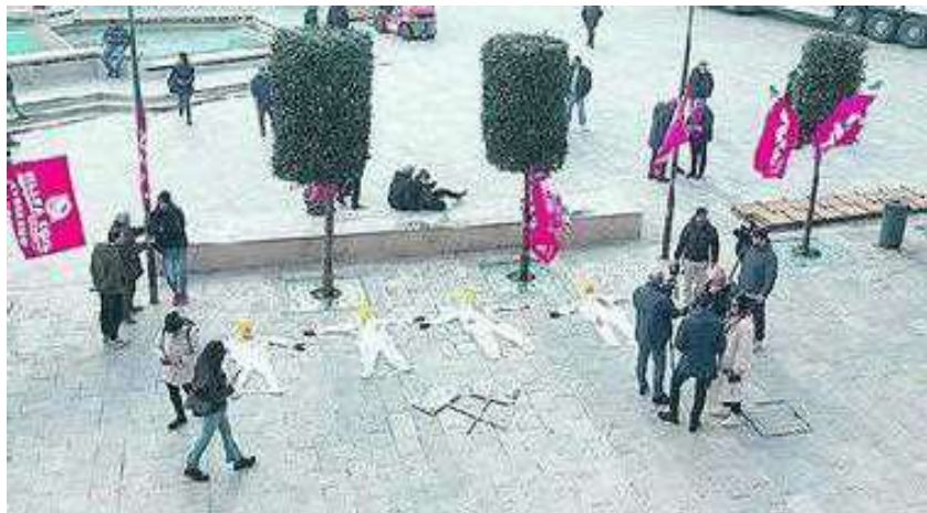
lia Avellino, servono 100 operai per la commessa da 400 autobus