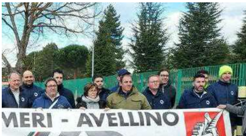
lia, interrogazione del Pd sull'acquisizione della Seri. Pizza: «Serve chiarezza»

ARTICOLO NON CEDIBILE AD ALTRI AD USO ESCLUSIVO DEL CLIENTE CHE LO RICEVE - 1749