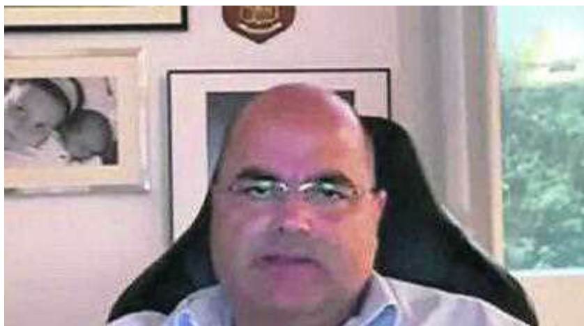
Civitillo-sindacato, muro sull'ingresso in lia