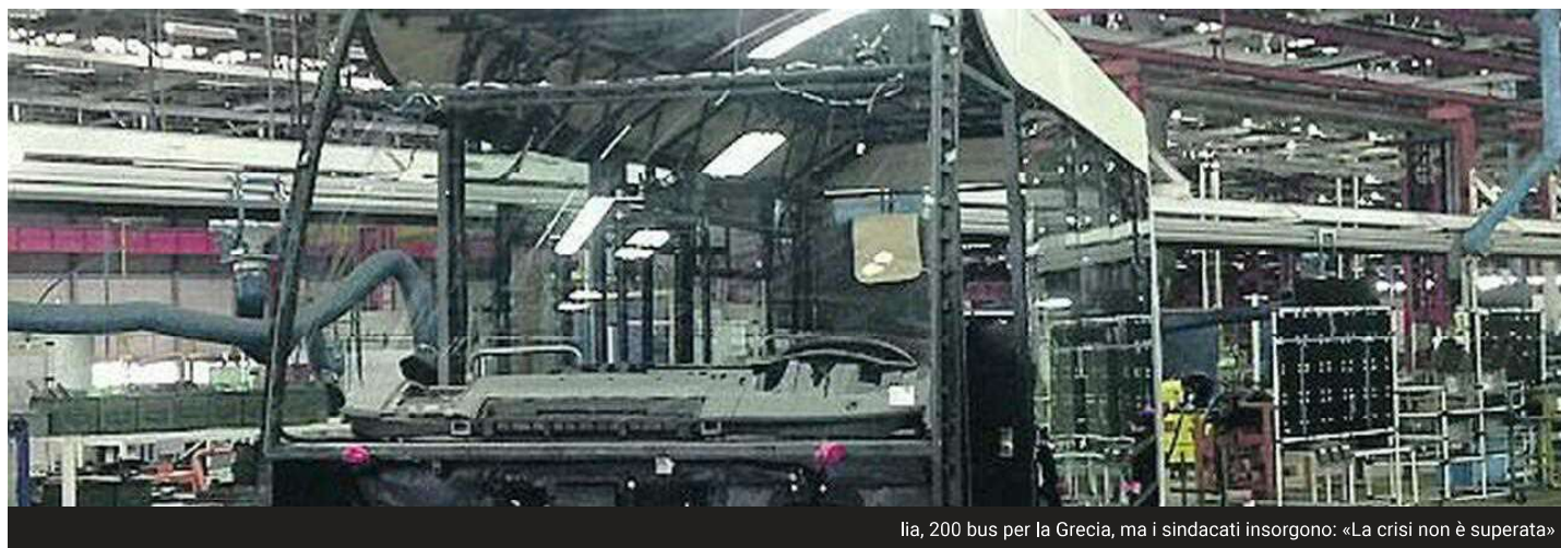
IIA, 200 bus per la Grecia, ma i sindacati insorgono: «La crisi non è superata»

L'azienda vince l'appalto del governo ellenico